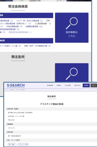
<発注案件掲載イメージ>

※サイトの写真はイメージです。実際のデザイン・掲載内容と異なる場合がございます。