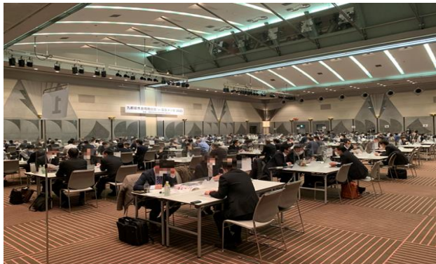
令和4年度に実施した「九都県市合同商談会2023」の商談風景 (会場:幕張メッセ コンベンションホール)

首都圏産業の国際競争力の強化を図るため、平成20年度から九都県市(埼玉県、千葉県、東京都、神奈川県、横浜市、川崎市、千葉市、さいたま市、相模原市)が連携して合同商談会を開催し、今回で16回目を迎えます。