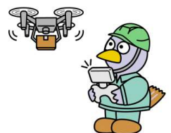
埼玉県マスコット「コバトン」