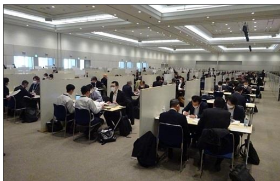
令和5年度に実施した「九都県市合同商談会2024」の商談風景 (会場:パシフィコ横浜 アネックスホール)

首都圏産業の国際競争力の強化を図るため、平成20年度から九都県市(埼玉県、千葉県、東京都、神奈川県、横浜市、川崎市、千葉市、さいたま市、相模原市)が連携して合同商談会を開催し、今回で第17回目を迎えます。