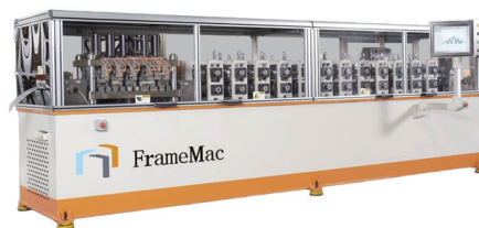
自社製作のロール成形機

■ロール成形機的设计から製作、据え付け、アフターサービスまでをスピーディーなワンストップで提供しています。また、海外の大手鉄鋼メーカーとの直接取引により、リーズナブルな価格でのJIS規格鋼材の提供を実現しています。コイル材の分条やシート材のレーザー切断などの加工も対応します。さらに、中国市場進出を目指す企業に、中国企業との商談や現地視察、資料作成など、現地マーケットに精通している強みを生かしサポートを行っています。