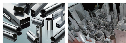
さまざまな形状の高精度素形材