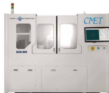
砂型造形3Dプリンター

試作・開発期間の短縮、これまでの設計制約を外して鑄造部材の薄肉軽量化、内部形状・外部形状の複雑化、ネットシェイプ化が実現できます。鑄造部材の付加価値向上、それを使用する製品の性能向上が図られます。