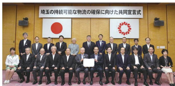
令和6年9月3日(火) 埼玉の持続可能な物流の確保に向けた共同宣言式

人手不足を克服し、持続可能な物流体制の構築できるよう、関係者が一丸となって取り組んでまいります。