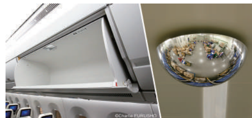
手荷物入れの忘れ物防止に

■身近なコンビニから航空機まで、安全、防犯、サービス、効率アップ、衝突防止に役立つミラーの企画、製造、販売を行う会社です。航空機の手荷物入れ用ミラーは乗客の方の忘れ物を防止するため、また客室乗務員が忘れ物や不審物などがなく素早くチェックするために設置され、世界のエアライン100社以上に採用されています。売り上げの拡大よりも“出会いの喜び”“創造の喜び”“信頼の喜び”を味わえる仕事を大切にしています。