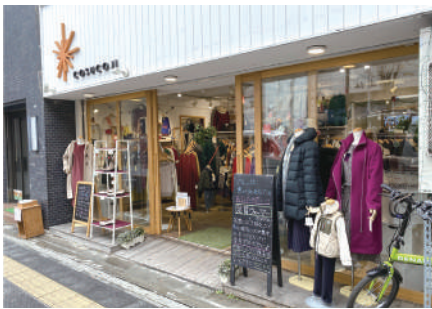
店舗により営業日時、定休日が異なるので、ホームページを参照

株式会社コスコジ https://www.cosucoji.com 北浦和本店：さいたま市浦和区北浦和3-1-15 創業 2007年8月 TEL 048-831-0177 資本金 200万円 従業員数 14名 事業内容 洋服店