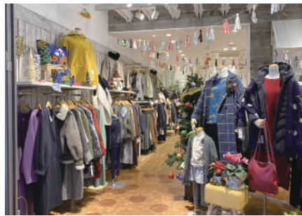
15坪ほどの店内には厳選した商品を取りそろえ、8割は日本製で、ヨーロッパ製もラインアップ